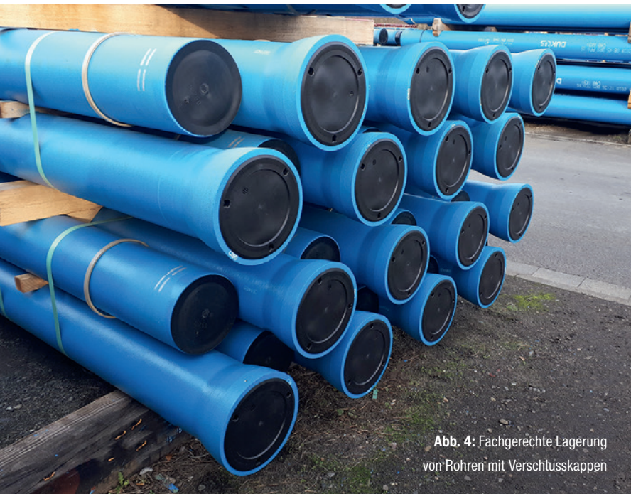
Abb. 4: Fachgerechte Lagerung von Rohren mit Verschlusskappen