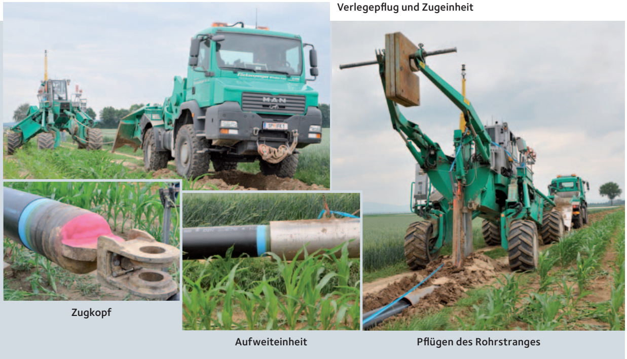
Verlegeflug und Zugeinheit